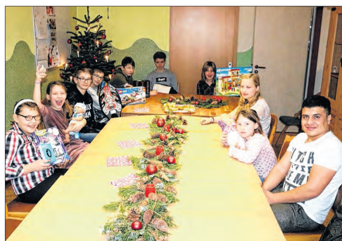
Nach dem leckeren Brunch und dem Auspacken der Geschenke sind durchweg zufriedene Gesichter zu sehen.

Bevor sich jedoch ein Teil der Kinder aus dem Staub macht, hatte auch die Wohngruppe an der Breite zu einer kleinen Feier mit Brunch eingeladen. Auf dem Speisenplan standen leckere Sachen wie Kartoffel- oder Nudelgratin, gefüllte Champignons, Wildbraten, Schnitzel, Bouletten und verschiedene Gemüse. Und natürlich waren die Steppkes mehr als gespannt, ob das Christkind auch ihre Wunschzettel