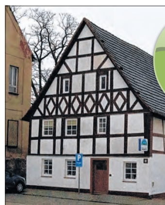
Heute sieht das Fachwerkhaus so aus.