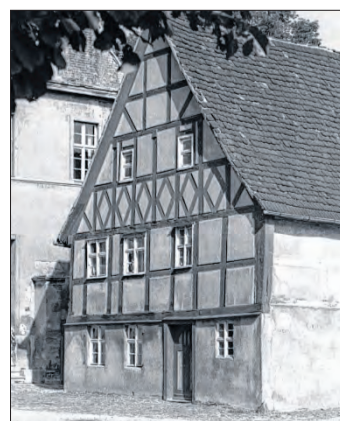
Eine historische Aufnahme der Breite 49.