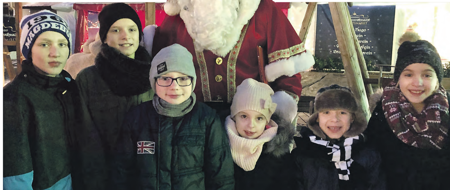
Jede Menge Spaß und Erlebnisse hatten die Kinder und Jugendlichen bei einem gemeinsamen Ausflug auf den Dessauer Weihnachtsmarkt.