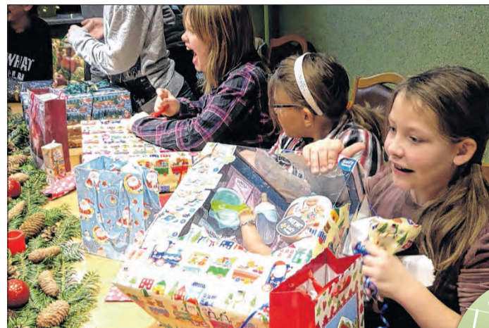
Was wäre eine Weihnachtsfeier ohne Geschenke. Vor allem das Auspacken ist spannend. Wurden alle Wünsche erfüllt?

abgearbeitet hat, denn nach dem Schlemmen stand die Bescherung auf dem Programm.